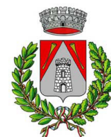
Comune di Sona